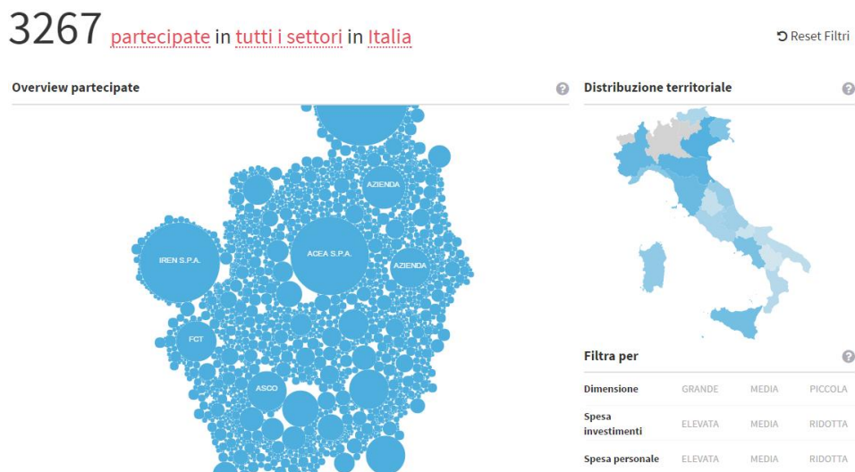
Figura 2- Viste sull'universo navigabile a partire dalla home page del portale OpenPartecipate - versione giugno 2016

La navigazione del portale OpenPartecipate permette di visualizzare in modo dinamico combinazioni di indicatori economici, quali il peso della spesa per investimenti e personale, con informazioni anagrafiche sulla tipologia dei soggetti e sul loro Settore di attività.